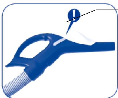
Tasto di Programmazione Impugnatura Brava Wireless

Completata la procedura di allineamento tra la Master e le Slave occorre programmare le Impugnatura Brava Wireless con la Master; come procedere: