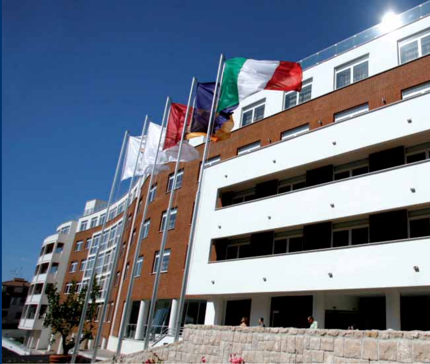
Domina Hotel & Conference Capannelle Roma