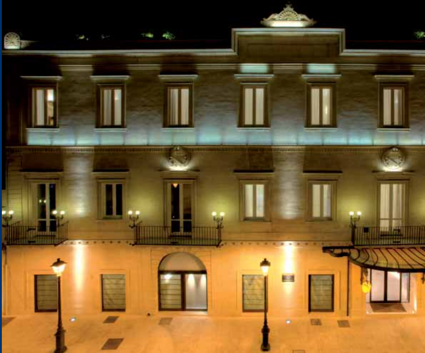
Risorgimento Resort Lecce