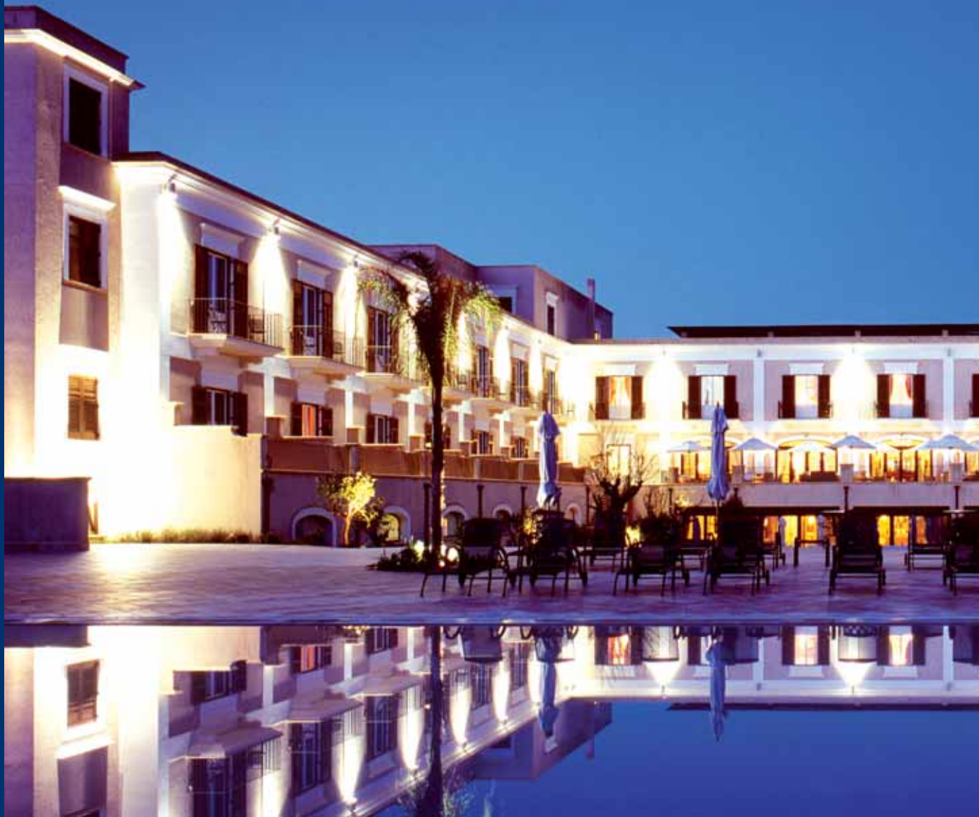
Kempinski Hotel Giardino di Costanza Mazara del Vallo (TP)