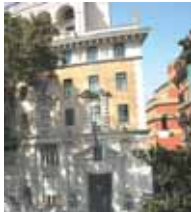
Boscolo Hotel Palace Roma