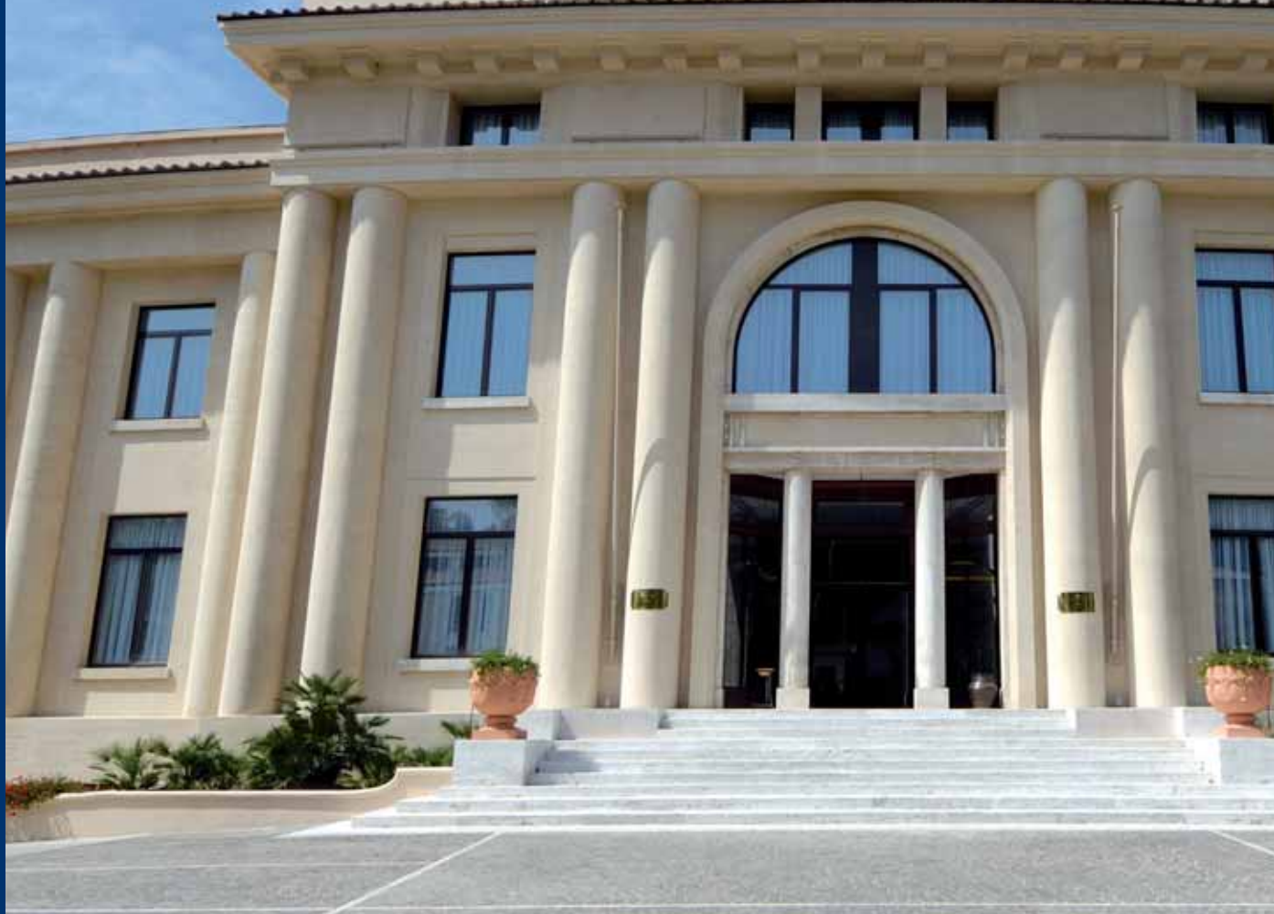
Grand Hotel Terme della Fratta Bertinoro (FC)