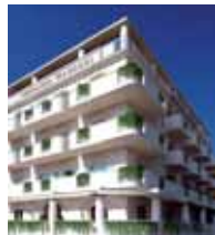
Terrazza Marconi Hotel & SpaMarine Senigallia (AN)