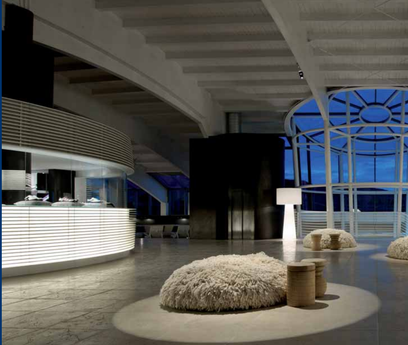
Argentario Golf Resort & SPA Porto Ercole (GR)