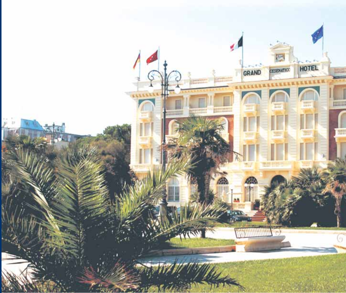
Grand Hotel Cesenatico Cesenatico (FC)