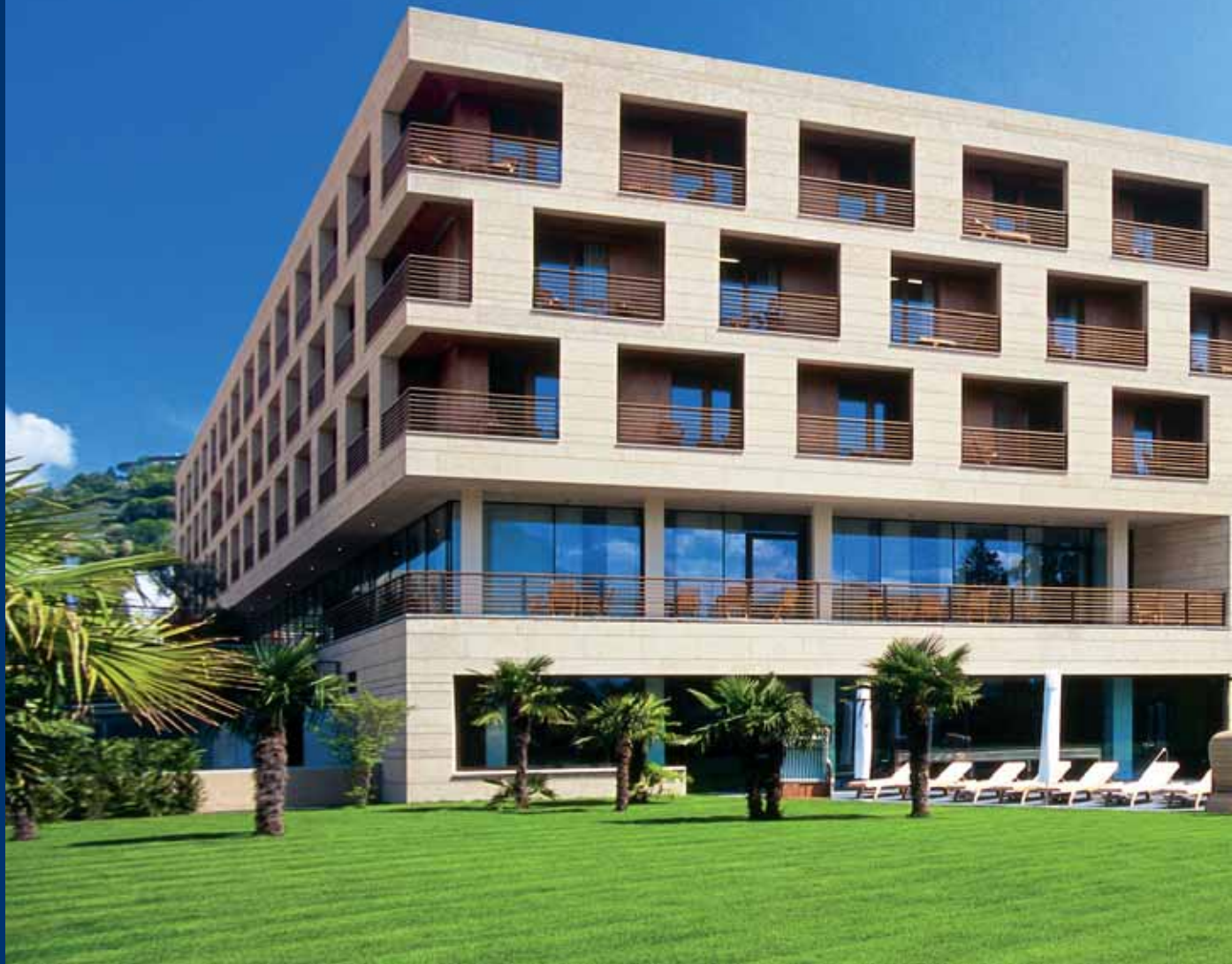
Steigenberger Hotel Terme di Merano Merano (BZ)