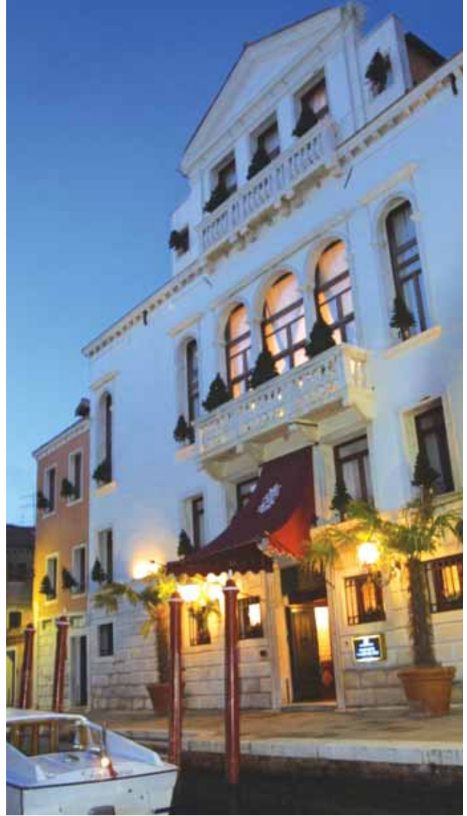
Boscolo Hotel Bellini Venezia