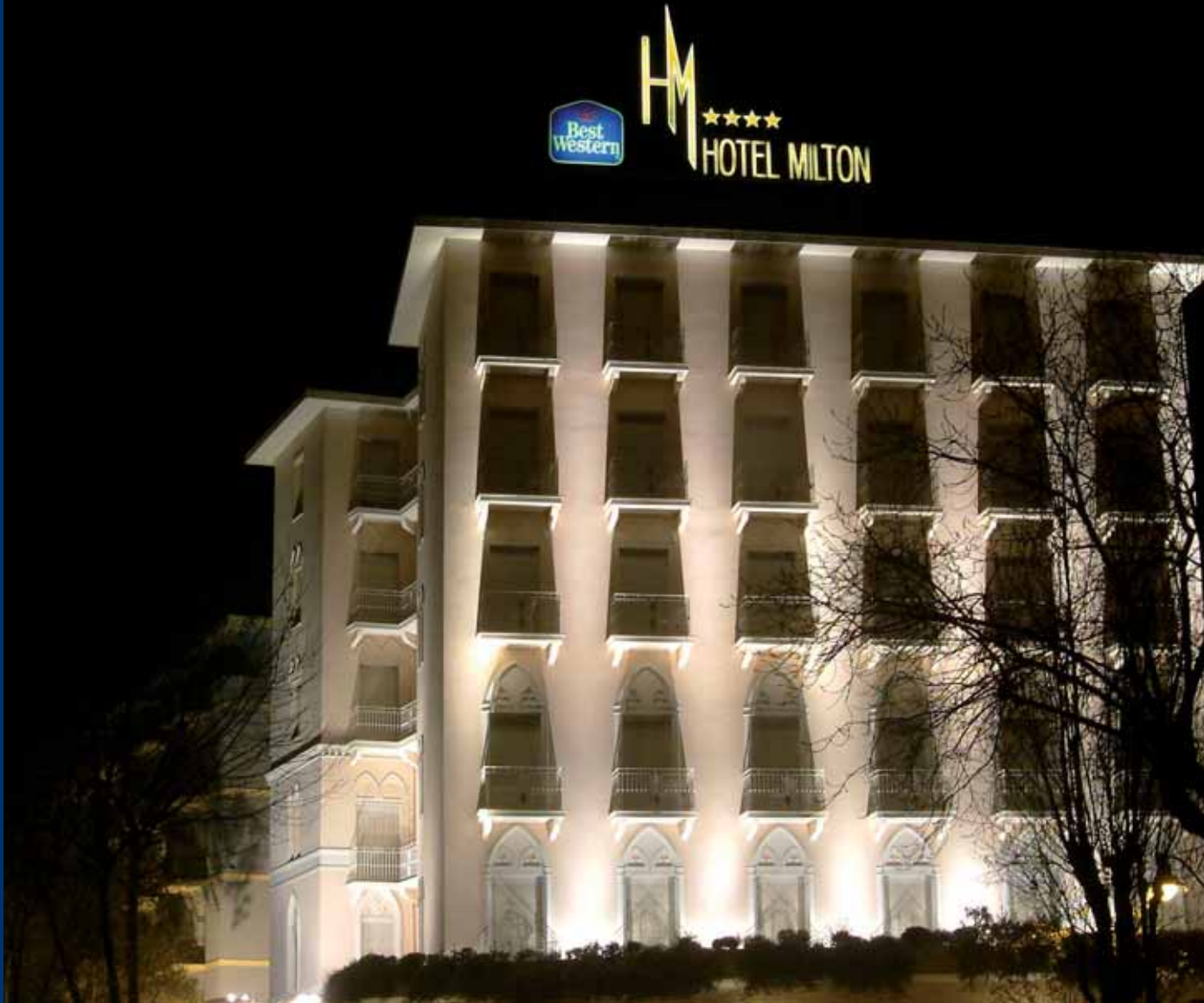
Best Western Premier Hotel Milton Rimini