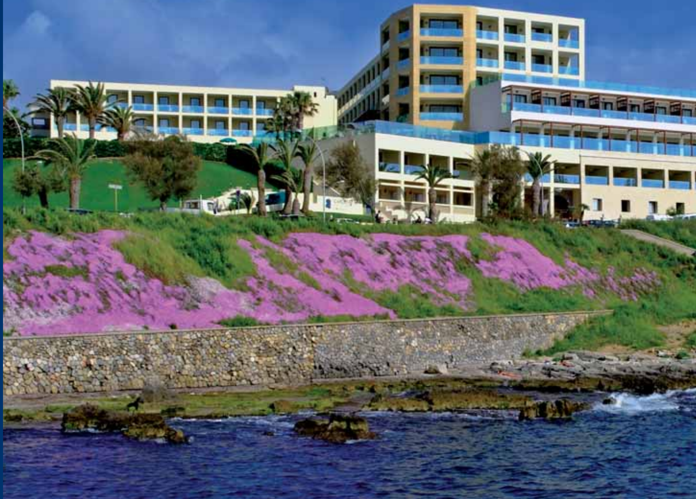
Hotel Carlos V Alghero (SS)