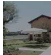
Delle Arti Design Hotel Cremona